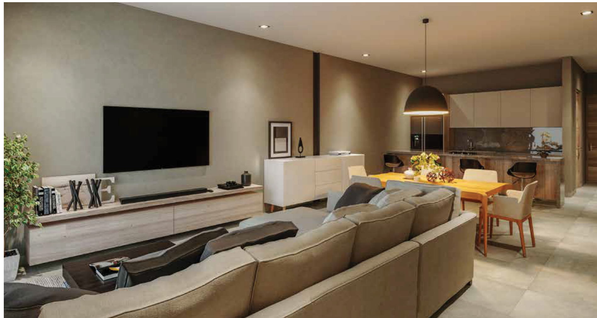
Sala comedor Prototipo 115a